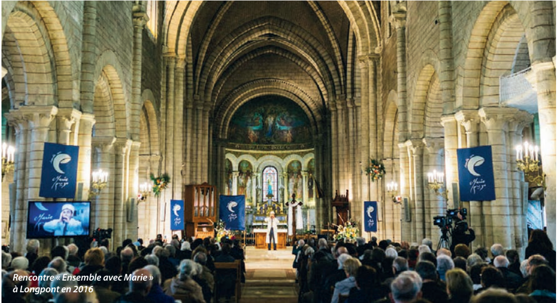
Rencontre « Ensemble avec Marie » à Longpont en 2016

Dans nos communautés chrétiennes, nous faisons l'apprentissage de la fraternité. Elle est appelée à dépasser le cadre de nos communautés pour viser la fraternité humaine tout simplement. Dans la parabole du bon samaritain, ceux qui passent leur chemin sont ceux-là mêmes qui rendent un culte à Dieu. Or, saint Jean Chrysostome nous rappelle qu'il existe un « sacrement » méconnu mais pourtant fondamental : le « sacrement du frère », tout aussi important que le sacrement de l'autel, et aussi que l'amour de Dieu est inséparable de l'amour du frère. « En vérité je vous le dis, ce que vous avez fait au plus petit de mes frères, c'est à moi que vous l'avez fait » (Mt 25,40). Ce chemin de fraternité universelle peut être parcouru par des esprits libres, assurés dans leur appartenance, solides dans leur foi, confiants dans leur appel et leur mission, ouverts à l'altérité. Je pense person-